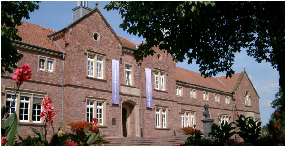
Astorhaus Walldorf